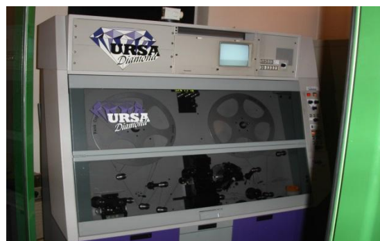
TELECINEMA URSA DIAMOND ( 35 / 16 /sup.8 / 8mm)

Per qualsiasi delucidazione e/o informazione in merito, potete contattarci tramite: